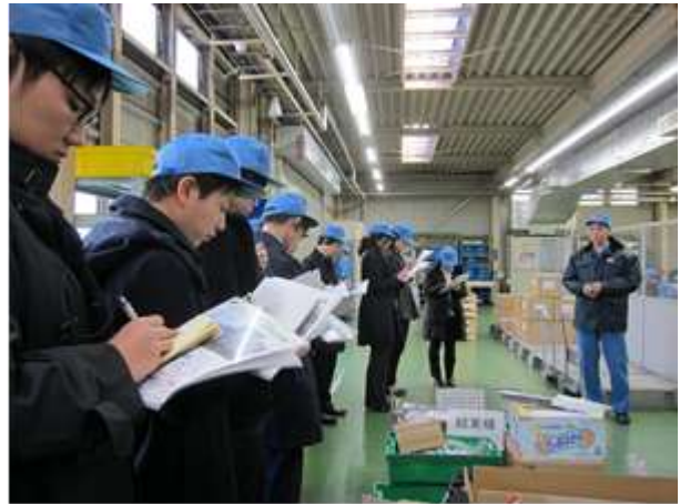
（備考）図表2～4まで信金中央金庫 地域・中小企業研究所撮影（29年1月24日）