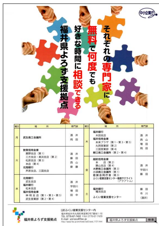
(図表8) 福井県よろず支援拠点パンフレット