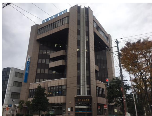
（図表3）福井信用金庫本店