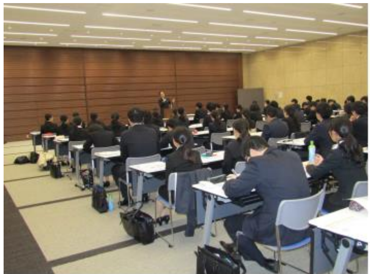
（図表 4）信金中央金庫の視察（講義風景）

4 月 11 日～21 日の 9 日間の集合研修では、独自のテキストやビデオを使用し、グループワークを交えながら実施した。