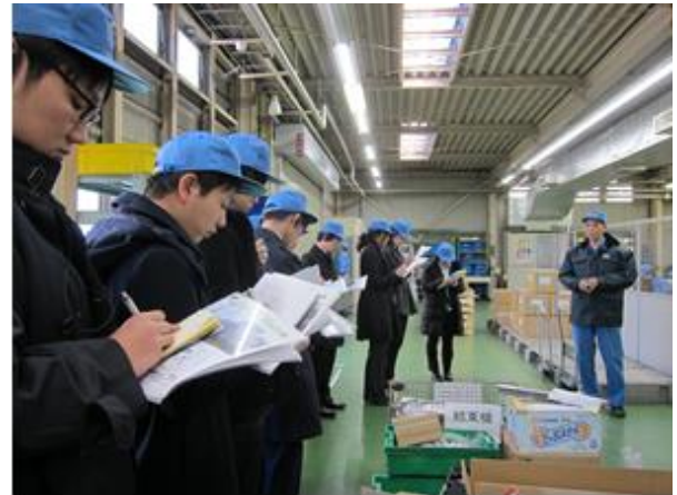
（図表8）ストラパック㈱（横浜工場）

同社では製造マシンの視察に加え、同金庫も協賛する「下町ボブスレー」 4 の実機を見ることができた（図表9）。