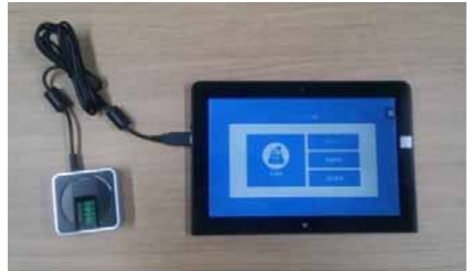
(図表6) 同社が開発した生体認証決済システム「手ぶらで決済」

同社は、今後、国内外で成功事例を次々と作りだしていくことにより、社名に含意されている想いのとおり、同社のシステムを世界の津々浦々に普及させたいと意気込む。